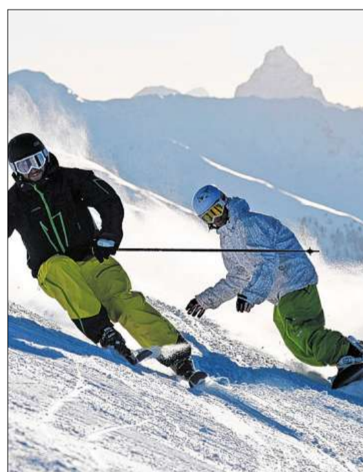
Davos Klosters startet in die Wintersaison. Archivbild, Foto Christian Perret

dkm | Die Pisten auf Parsenn stehen ab Freitagmorgen, 15. November, für Skifahrer und Snowboarder offen. Den momentanen Schneefall und die für nächste Woche angekündigte Kälteperiode können die Davos Klosters Bergbahnen (DKM) optimal nutzen, um den planmässigen Saisonstart zu ermöglichen. Der tägliche Skibetrieb wird vorerst auf Parsenn angeboten, auf den Pisten Nr. 15 Totalp und voraussichtlich Nr. 4 Rapid. Das Jakobshorn folgt, sobald es die Schneeverhältnisse zulassen. Das definitive Angebot an Anlagen und Pisten wird gegen Ende der nächsten Woche kommuniziert und entsprechend auch auf der Website www.davos.ch ersichtlich sein. Die Bergbahnabonnemente sind für den öffentlichen Verkehr (Gültigkeit gemäss Tarifbestimmungen) erst ab dem 22. November gültig. Vor dem 22. November ist bei Nutzung des öffentlichen Verkehrs entsprechend ein Ticket zu lösen.